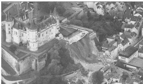
Figure 2 : Instabilité de versant due aux circulations d'eau

Face à cette complexité, le géotechnicien a pour principale arme les investigations ponctuelles, d'où le danger des interpolations entre sondages face aux anomalies locales difficilement détectables tels le puits perdu, le talweg fossile, la carrière.